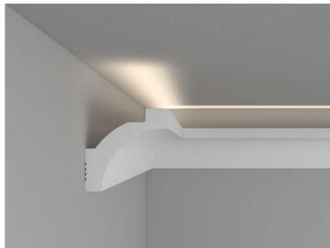
Lunghezza standard: 2000mm Consultare il catalogo per tutti i modelli e le misure